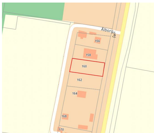
Ålborgvej 160 (rød markering)

Huset opføres i ét plan og med en beliggenhed som skitseret nedenfor.