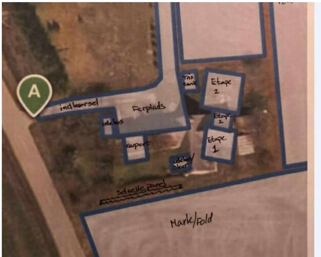
Placering af bolig (etape 1 og 2) samt solcelleanlæg på stativ