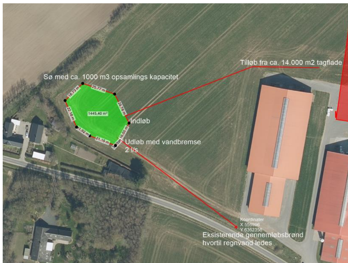
Placering af forsinkelsesbassin på Agervej 20

Hjørring Kommune giver hermed tilladelse 1 til anlæggelse af et forsinkelsesbassin på ca. 1400 m 2 på en del af ovennævnte ejendom. Søen etableres med en beliggenhed som vist nedenfor.