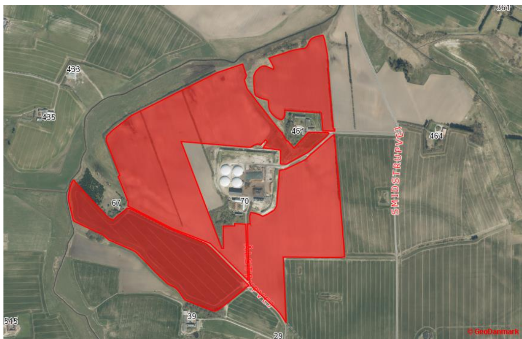
Figur 2. Angivelse af de marker, hvor der må ske udspredding af urent overfladevand fra biogasanlægget.