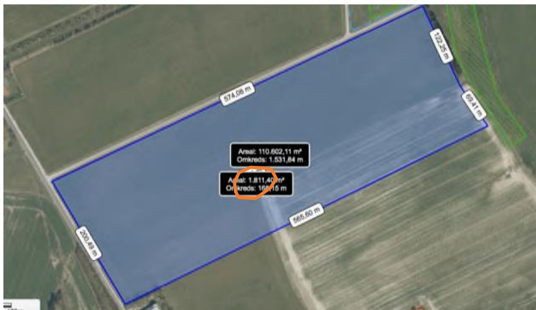
Placering af søen (med orange farve) på matr.nr. 4h Nr. Vrå By, Vrå

Hjørring Kommune giver hermed tilladelse 1 til anlæggelse af en sø på ca. 1800 m 2 på en del af ovennævnte ejendom. Søen etableres med en beliggenhed som vist nedenfor.