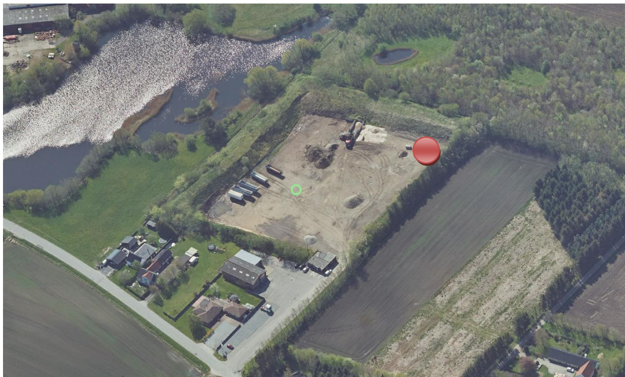
Rød markering viser placeringen af masten. Pladsen er omgivet af en jordvold samt træ-bevoksning