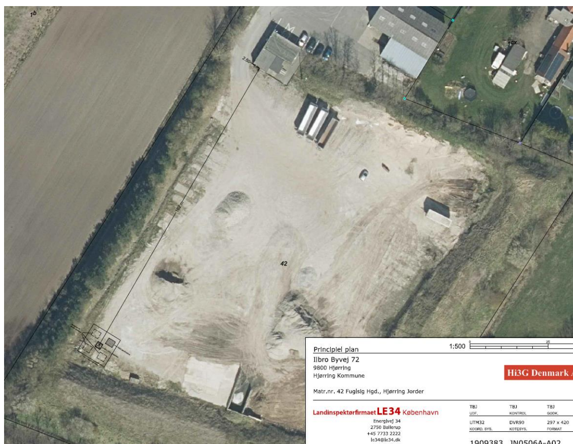
Placering af masten på Ilbro Byvej 72