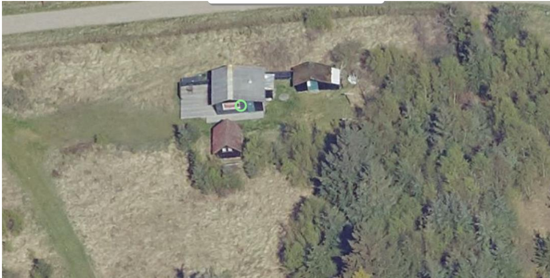
Fritidsboligen på Øster Kjulvej 2A samt 2 annekser