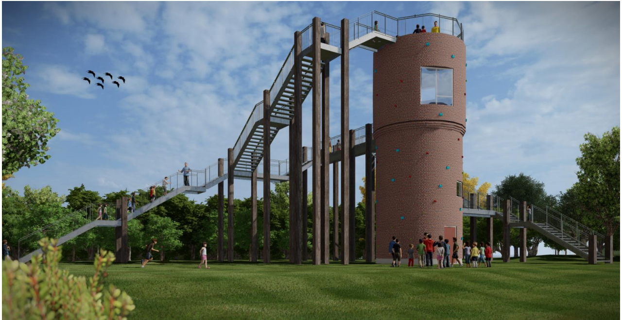
Illustration af det renoverede/ombyggede vandtårn med ny trappekonstruktion