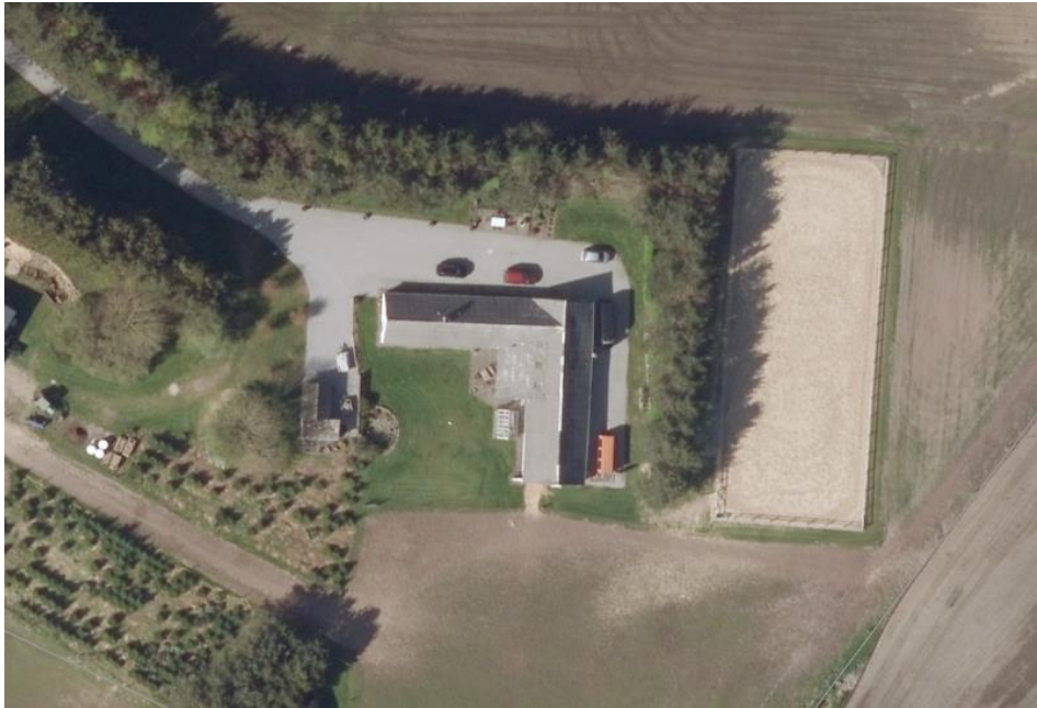
Grønnerupvej 20 idag