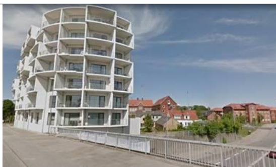
Etageejendom mod Bispensgade/Parrallelvej i Hjørring