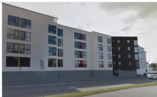
Karrébygning mod Østre allé i Aalborg.

I forbindelse med projekteringen, er der bestilt et redegørende notat inkl. støjberegninger fra et anerkendt rådgivende ingeniørfirma omkring de nøjagtige foranstaltninger der skal udføres for at boligerne og fællesarealer kan få et tilfredsstillende akustisk indeklima. Dette notat vil danne grundlag for projekteringen af de enkelte, konkrete løsninger vedrørende støj.