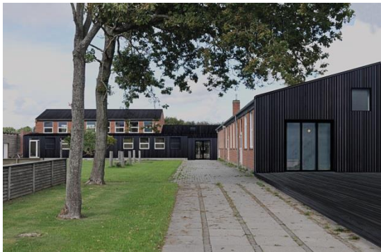
Visualisering af hvordan Byens Hus i Vrensted kommer til at se ud i fremtiden.

Projektet tog sin begyndelse i sommeren 2011, da byens skole blev lukket. Byens borgere og foreningssamvirke gik sammen om projektet Byens Hus for at sikre byens fremtid og fællesskab, og der blev oprettet en arbejdsgruppe, der skulle stå som tovholdere i udviklingen.