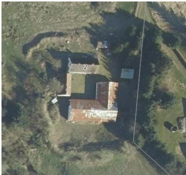
Luffoto fra 2019 med bygningerne der nu er nedrevet