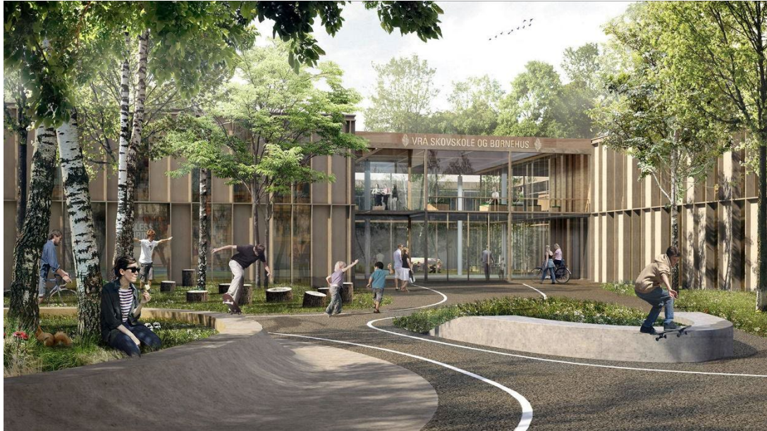
Vrå børne- og kulturhus