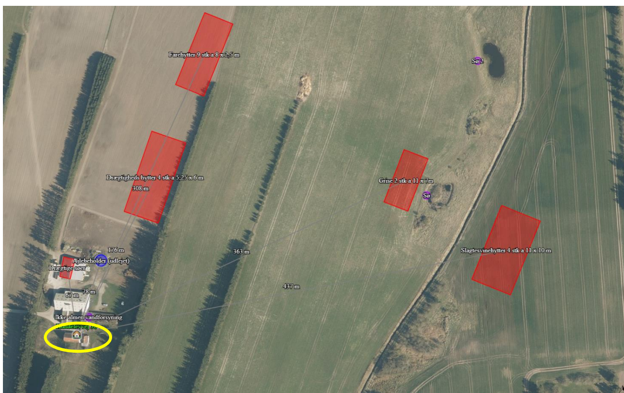
Figur 2: Nærmeste nabo uden landbrugspligt er beliggende i den gule ellipse