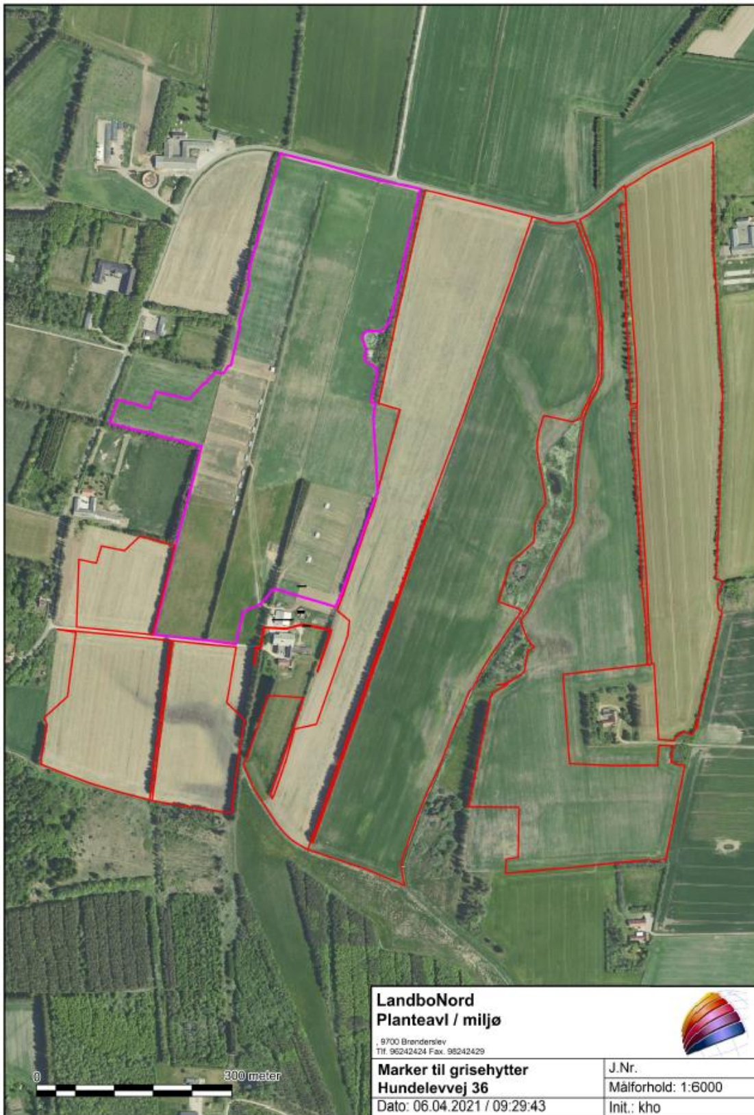
Figur 1: Marker hvor hytterne må stå