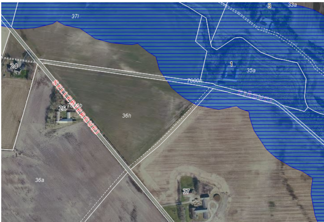
Fig. 2 Åbeskyttelseslinjen på matr. nr. 35a Sdr. Bindslev By, Bindslev

Der nedlægges ikke nyt kabel, men transformatorstationen flyttes fra den nuværende placering på matr.nr. 36h Sdr. Bindslev By, uden vejadgang, til en placering langs Ejåsvej, hvor kablet krydser vejen.